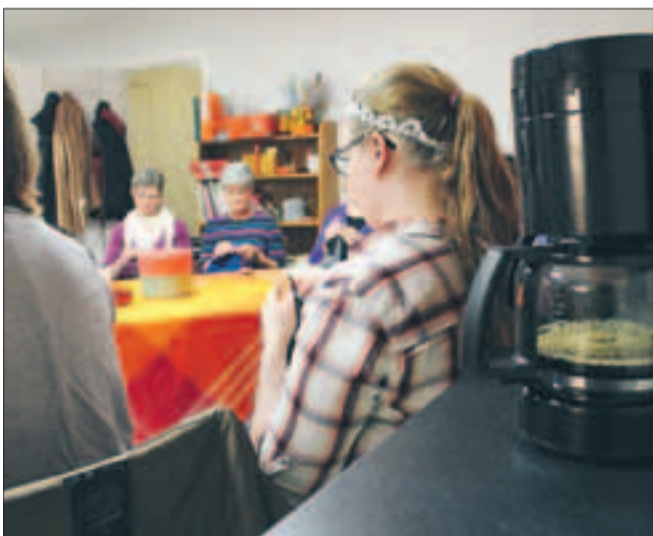
Kaffebryggaren står på i väntan på nästa fikapaus.