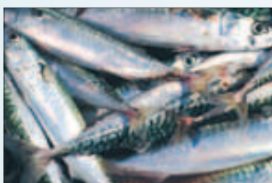
Nyss simmade de här makrillerna omkring i Älgöfjorden.

Älgöfjorden, till Tona, ett grund utanför Älgö gavel. Det är där de brukar ta sina makrillar. En häger lyfter när vi dånar förbi i hyrbåten och försvinner med kupiga vingslag.