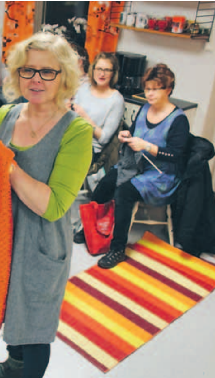
unt bordet och deltagarna har nära till skratt hela tiden.