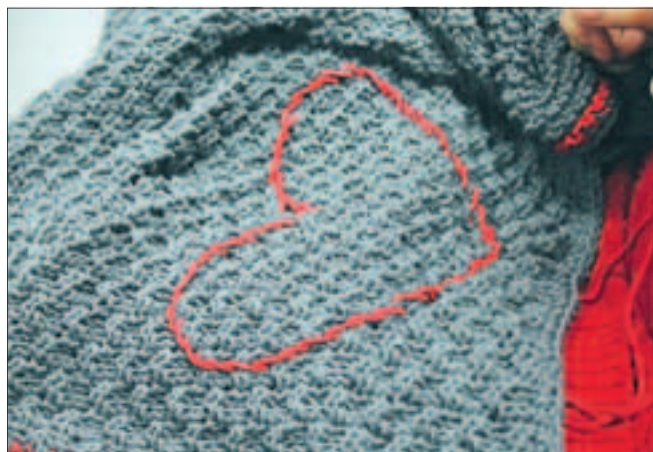
Stickarna har ett mönster att gå efter. Ett krav är att det skall vara ett hjärta på varje filt.